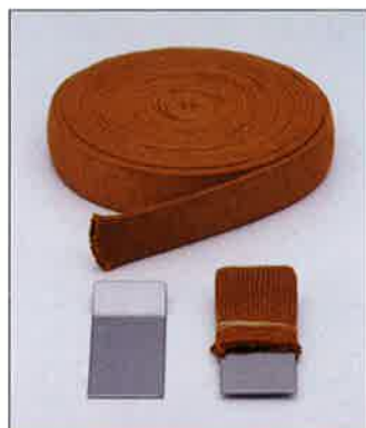
CBクロスL (ソフト) 筒状タイプ・伸縮性 (30mm×2.5M) (30mm×5M)