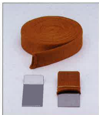
CBクロスL (ハード) 筒状タイプ (30mm×2.5M) (30mm×5M)