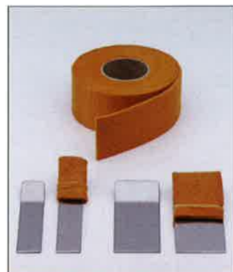
CBクロスF 帯状タイプ・フェールト (35mm×2.5M×2mm)