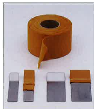
CBクロスC-45 帯状タイプ・布 (5cm×10M×0.45mm)