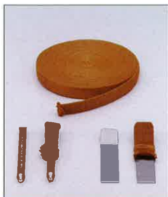
CBクロスS (ハード) 筒状タイプ (15mm×5M)

東洋紡により開発された、現存の有機繊維の中で、最も高耐熱、高強力なスーパー繊維ザイロン®を使用した、最強の電解研磨用クロスです。