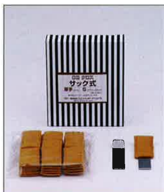
CBクロス・サック式S フェールトタイプ (23mm×45mm n×2mm) 1箱 30枚