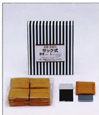
CBクロス・サック式L フェールトタイプ (39mm×45mm n×2mm) 1箱 20枚